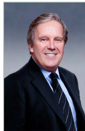
Ian Cook 董事长、总裁兼首席执行官

高露洁人为我们的业绩深感自豪。业绩固然重要，但取得业绩的方式同样重要。在此，我特向您表示感谢，感谢您一直以来恪守我们共同的价值观以及您在道德方面作出的表率，这一切对我们取得持续的商业成功至关重要。